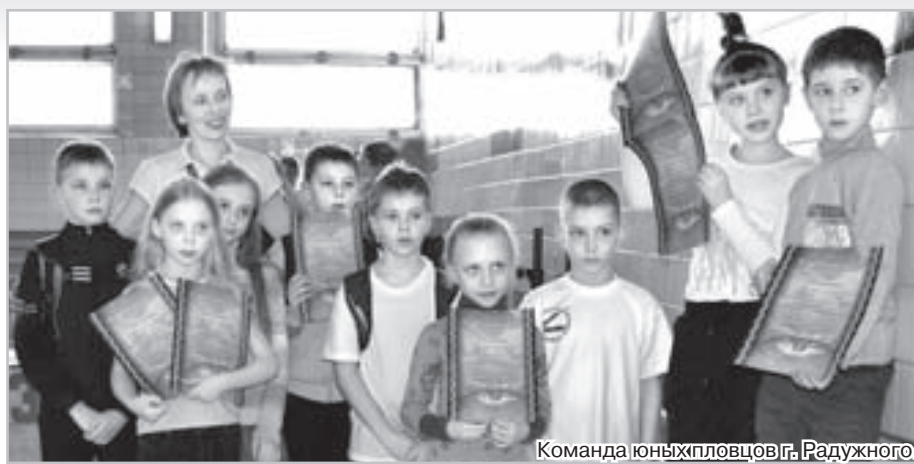
Команда юных пловцов г. Радужного.