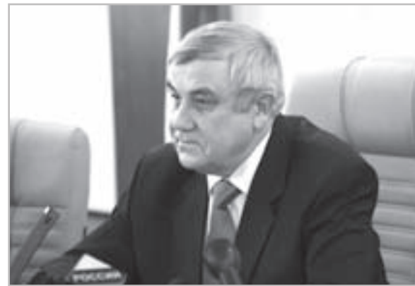
Николай Виноградов: «К разработке новых социальных программ будут привлекаться ветеранские, общественные организации».

Это предложение было поддержано Губернатором Николаем Виноградовым: «Включение в повестку дня коллегии вопроса реализации программы «Старшее поколение» было продиктовано пониманием важности и социальной значимости этой темы. Если оценивать количественную сторону проводимых в этом направлении мероприятий, нужно давать положительную оценку. Объем финансирования сопоставим с оказанием помощи сельхозпроизводству – это примерно 1,6 – 1,7 млрд. руб. в год – и объемом поддержки малого и среднего бизнеса. Денег выделяется немало с учетом еще и тех средств, которые выделяются муниципалитетами. Программа «Старшее поколение» будет расширена в 2014 году. Расширять ее нужно до участия органов мест-